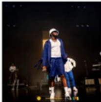
Diamond Platnumz

C'était samedi dernier, 25 juin 2022, le ZIMIX Festival a tenu à ses promesses et rassemblé de nombreux fans et curieux dans la grande et belle salle Métropole à Lausanne. La diversité musicale africaine était célébrée avec 2 icônes que sont Fally Ipupa et Diamond Platnumz.